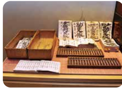
明治時代に使用していた算盤や仕入帳