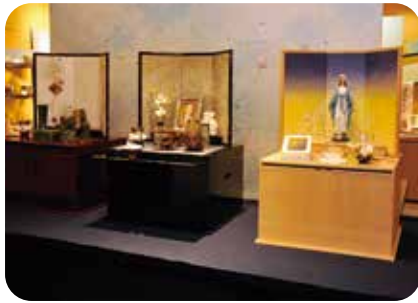
さまざまな宗教や宗派にも対応できる仏壇