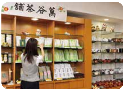
豊富な品揃えの茶葉と茶器