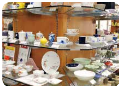
宮内庁御用達の陶器メーカーの製品も充実