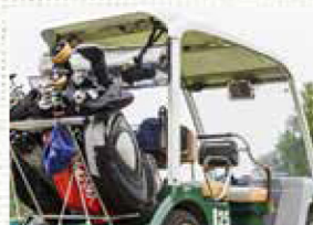
ゴルフ場ナビを導入したカート