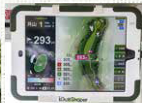
ゴルフ場ナビの画面